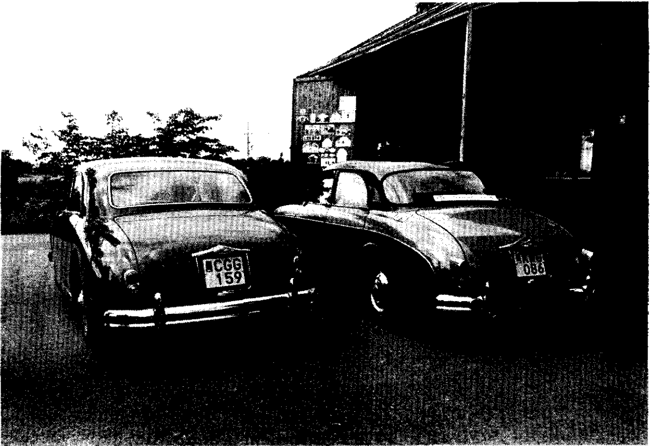
Plats för stilstudier: Nils Johan Nilssons Pathfinder och Hugo Josefssons Two-Point-Six parkerade utanför "The Moeller Collection".