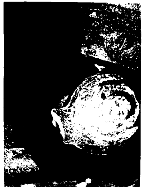
En närbild av den bräckliga "lugen" som sitter mellan stötdämparen och hjulupphängningen på RM-vagnar. Redaktören har brutit tre stycken!!!