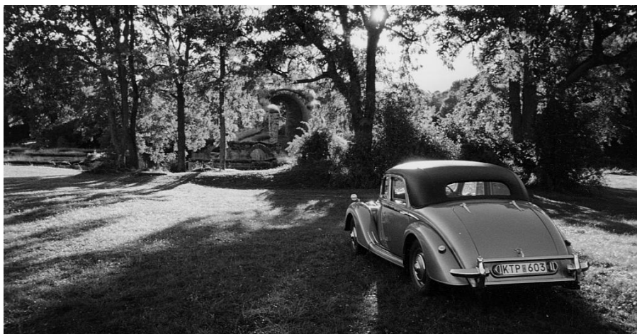
Historiens vingslag och en sakta nedgående sol svävar över en Riley vid ruinerna av Alvastra kloster en septemberdag 2002.