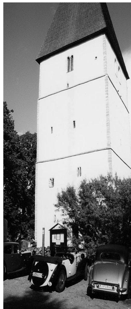
Det mytomspunna tornet till Bjälbo kyrka

Församlingen skingrades sedan farväl tagits vid kajen längs Motala ström. Personligen tyckte jag att det var ett utmärkt trevligt arrangemang. Tack!