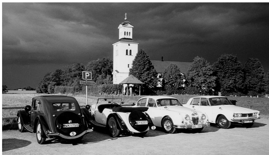
Rökstenen är Sveriges förmodligen mest kända, och av många ansedd som vackraste runsten, belägen vid Röks kyrka i Östergötland. Rökstenen berättar en säregen och dunkel historia om flera kungar och återger troligen delar av en nordisk mytologi som sedan dess gått förlorad. Den "Tjodrik den dristige" som omtalas på stenen är sannolikt identisk med den gotiske kungen Theoderik den store.