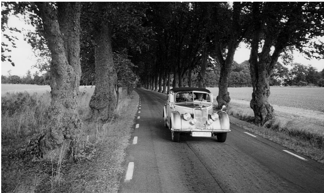
A perfect Riley lane. Red. misstänker att många missade denna väg eftersom han körde först ifrån Bjälbo kyrka, följde road booken, men kom sist till Rökstenen...