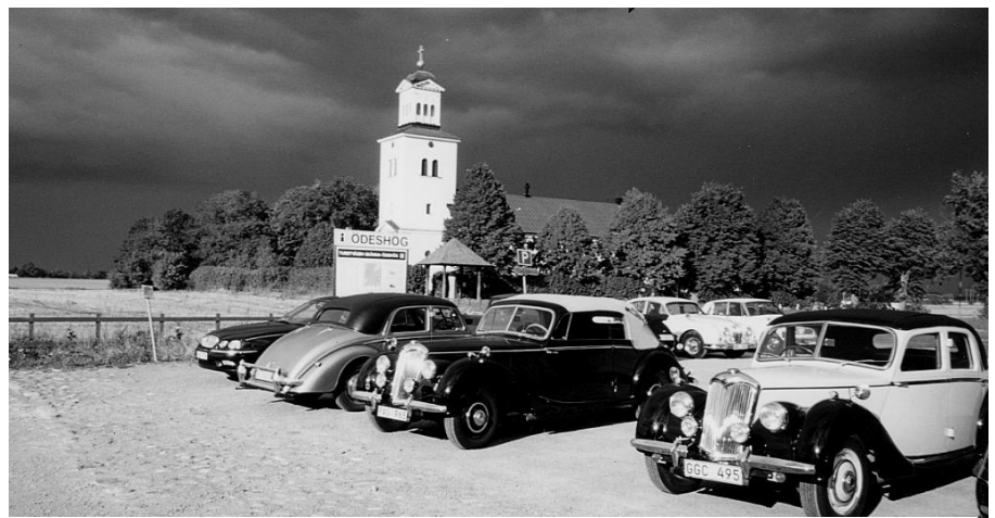
Röks kyrka, Rileys och rysliga moln