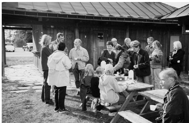
Kaffekalas vid Rökstenen och Röks kyrka