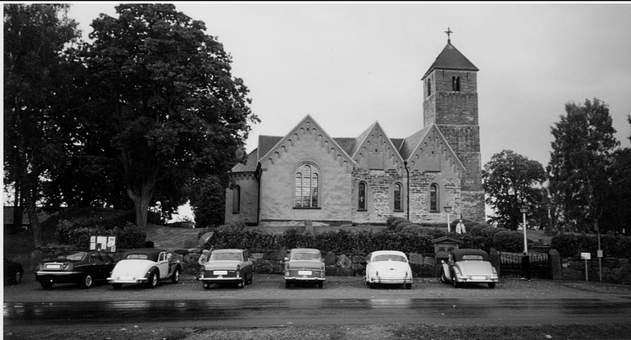
Heda kyrka bär vissa drag efter Rileyfabriken i Coventry...