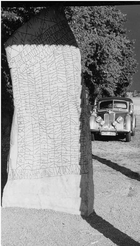
Rökstenen och Riley

Om kulturhistoriska rallyn tycker jag mycket! Västerås rallyt 91 var en höjda-re, och nu hade samma arrangörer varit i farten igen. Vackert solbelyst svensk kulturbygd där Rileys rullar fram genom smala gränder och lummiga alléer... ja, det är så man får tårar i ögonen.